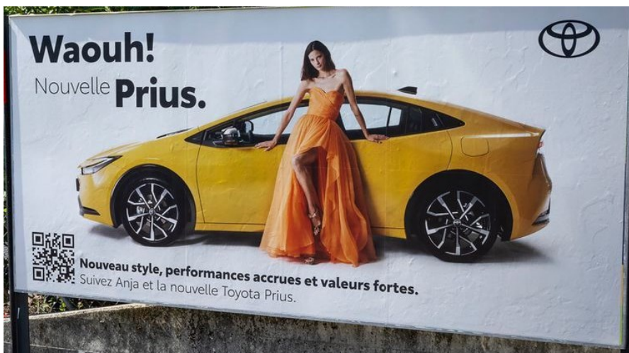
Affiches publicitaires pour Toyota, 2023.