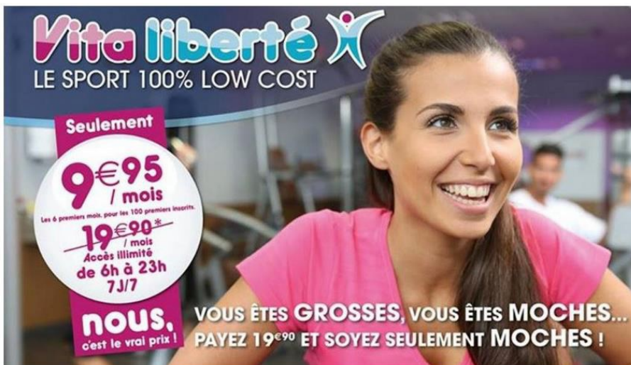
Affiches publicitaires pour vita liberté, 2014.