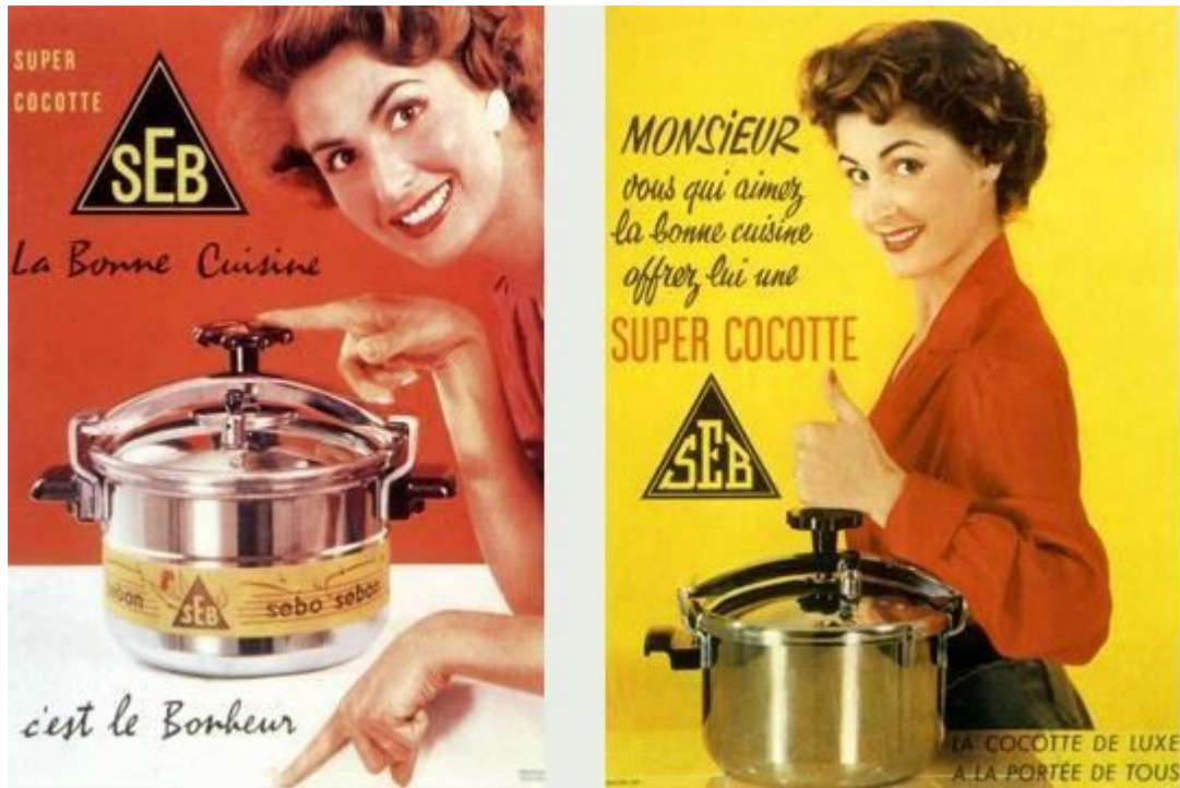
Affiches publicitaires pour des produits SEB, 1950.